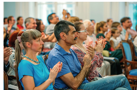
Публика на концерте Международной школы, 2018

Задача фестиваля «Собираем друзей» – показать не только музыкальное искусство различных культур, но заинтересовать, продемонстрировать глубину и индивидуальность