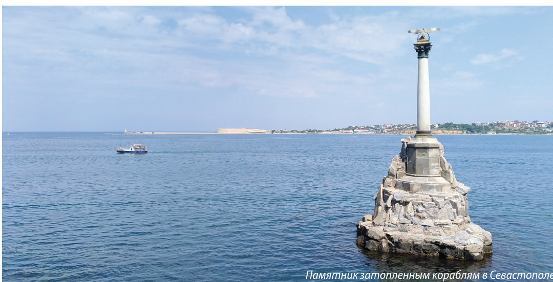
Памятник затопленным кораблям в Севастополе

Действительно, в истории Севастополя и Московской консерватории есть много интересных точек соприкосновения. Так, автором музыки гимна «Легендарный Севастополь» является Ванно Мурадели, воспитанник нашей Консерватории. Один из лучших драматических театров Севастополя назван именем наркома просвещения А.В. Луначарского, сыгравшего в истории Московской консерватории заметную роль. Великий русский певец Леонид Собинов, часто выступавший в Большом зале и живший рядом с Консерваторией, заведовал в Севастополе отделом народных