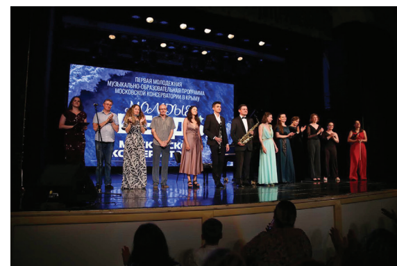
Концерт-открытие в Севастополе