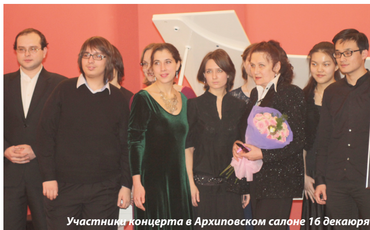
Участники концерта в Архиповском салоне 16 декабря