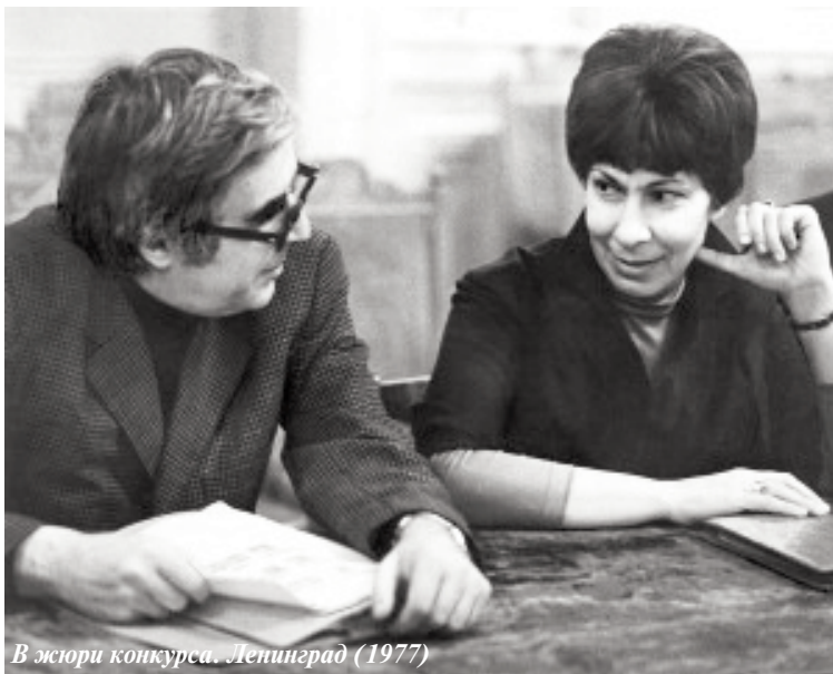
В эссе конкурса. Ленинград (1977)