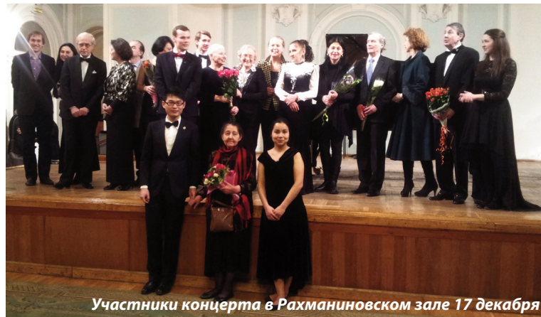
Участники концерта в Рахманиновском зале 17 декабря