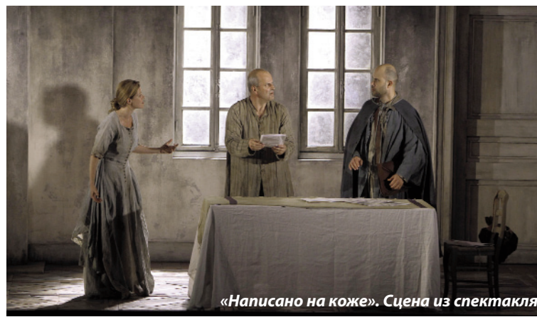
«Написано на коже». Сцена из спектакля

2017-й год для Большого театра ознаменован сразу несколькими крупными проектами совместно с знаменитым французским Оперным фестивалем Экс-ан-Прованса. Это сотрудничество достигнет своей кульминации осенью, когда постановка генделевской «Альцины» из Экса будет перенесена в Москву и войдет в репертуар Большого, став третьей оперой Генделя за 160 лет истории театра (в 1959-м был поставлен «Юлий Цезарь в Египте», в 2015-м – «Роделинда» в копродукции в Английской национальной опере).