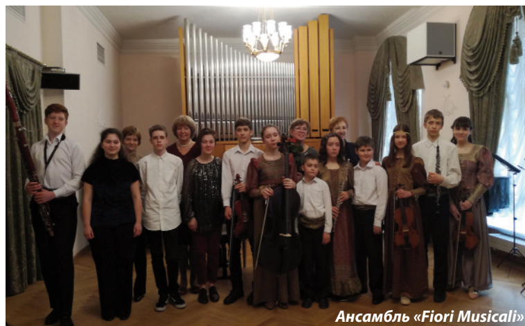
Ансамбль «Fiori Musical»

Владислав Тарнопольский