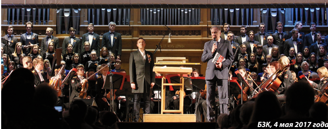
БЗК, 4 мая 2017 года