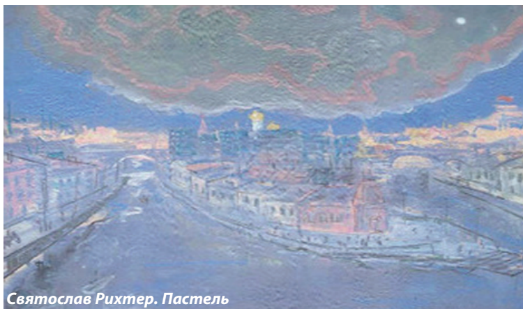
Святослав Рихтер. Пастель