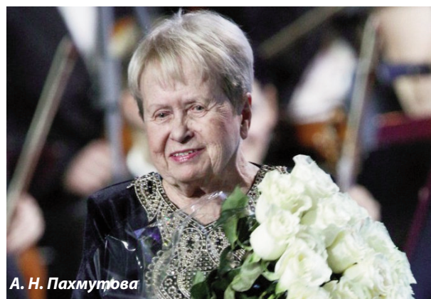
А. Н. Пахмутова