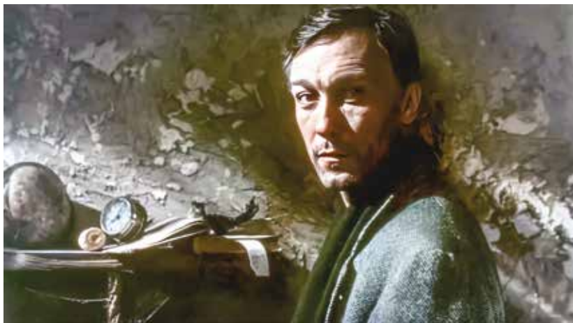
Олег Янковский в фильме А.Тарковского «Ностальгия»