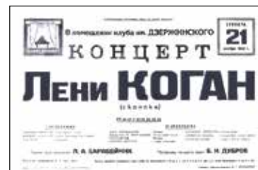
Афиша концерта в Куйбышеве. 21 ноября 1942 г.