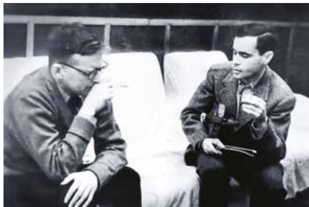
С Дмитрием Шостаковичем

Леонид Коган (председатель жюри), Сальваторе Аккардо, Владимир Аврамов. Международный конкурс имени П.И. Чайковского. 1978