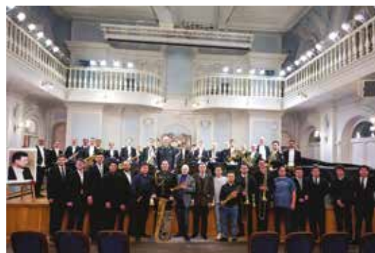
Закрытие фестиваля. 7 октября 2024 г.