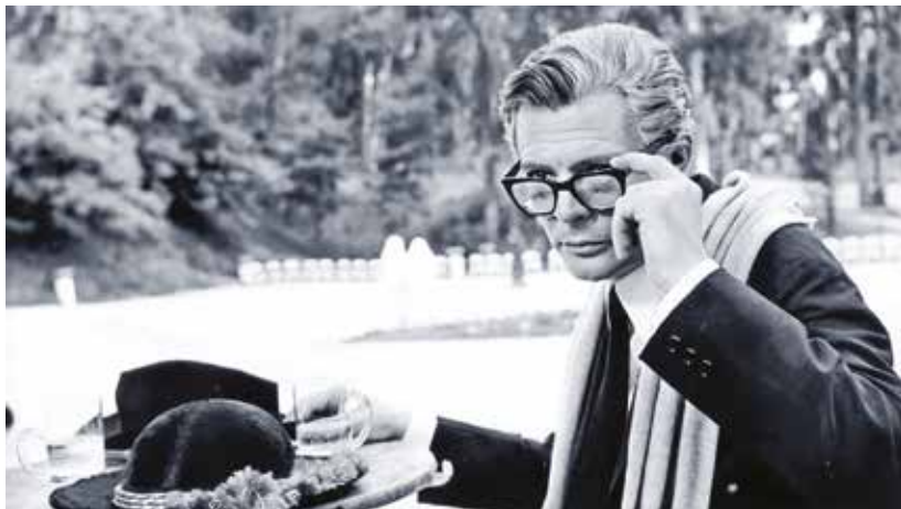
Марчелло Мастрояни в фильме Ф. Феллини «Восемь с половиной»