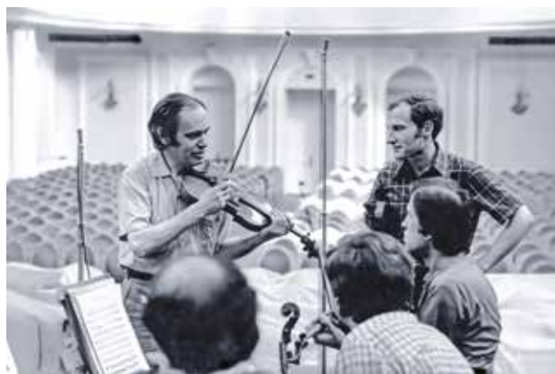
На репетиции в Большом зале Московской консерватории