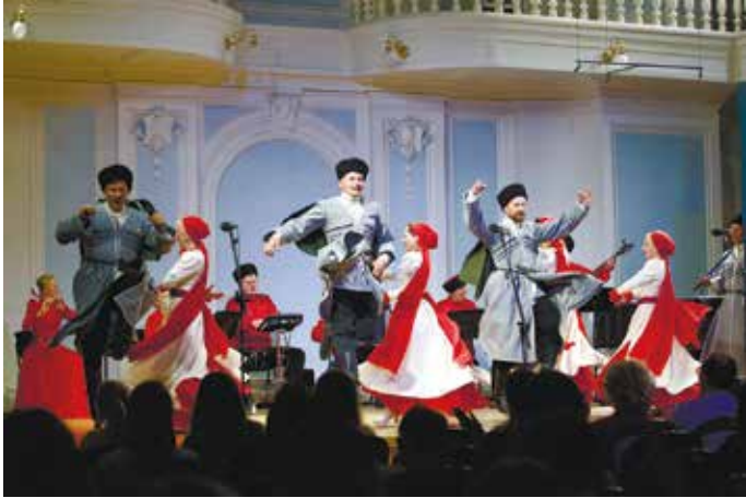
Ансамбль казачьей песни «Атаман» имени А.М. Красноперца

в «мертвый сезон», да еще такой жаркий можно было не ожидать. Но, как оказалось, тревога была напрасной: публики в зале было достаточно, и большим подспорьем оказались интернет-трансляции, собравшие огромную аудиторию. На ту пору ТВ Консерватории, замечательно показав в живом эфире концерты фестиваля «Россия – Вселенная звука», Международный конкурс Сергея Рахманинова и множество других консерваторских проектов, должно было, наконец, вздохнуть и набраться сил перед следующим сезоном. На помощь пришли давние друзья из компании LIVE GROUP , проведя трансляции всех концертов и сняв для истории все прочие события фестиваля.