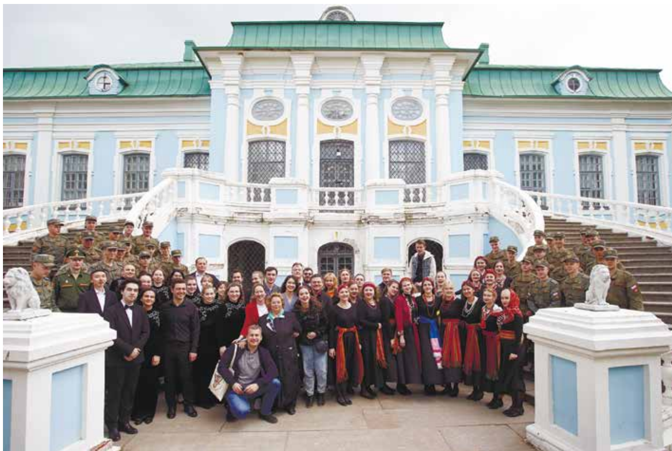
На фоне музея Грибоедова в Хмелите

«По капле дождь, а дождь реки поит, а реками море стоит...»