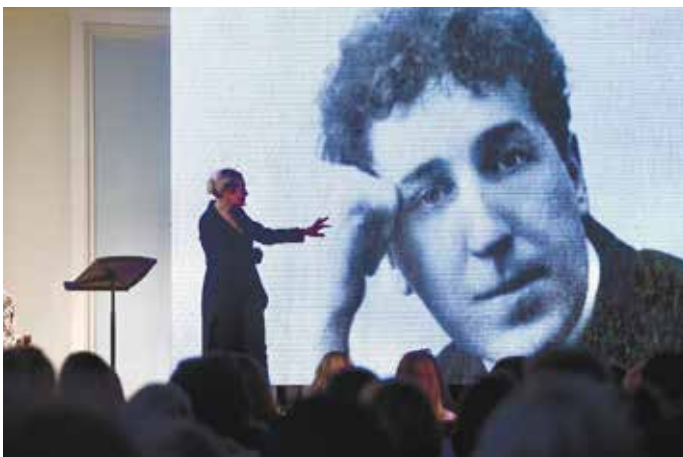
Музыкальный спектакль «Ананасы в шампанском / Дневник его души»