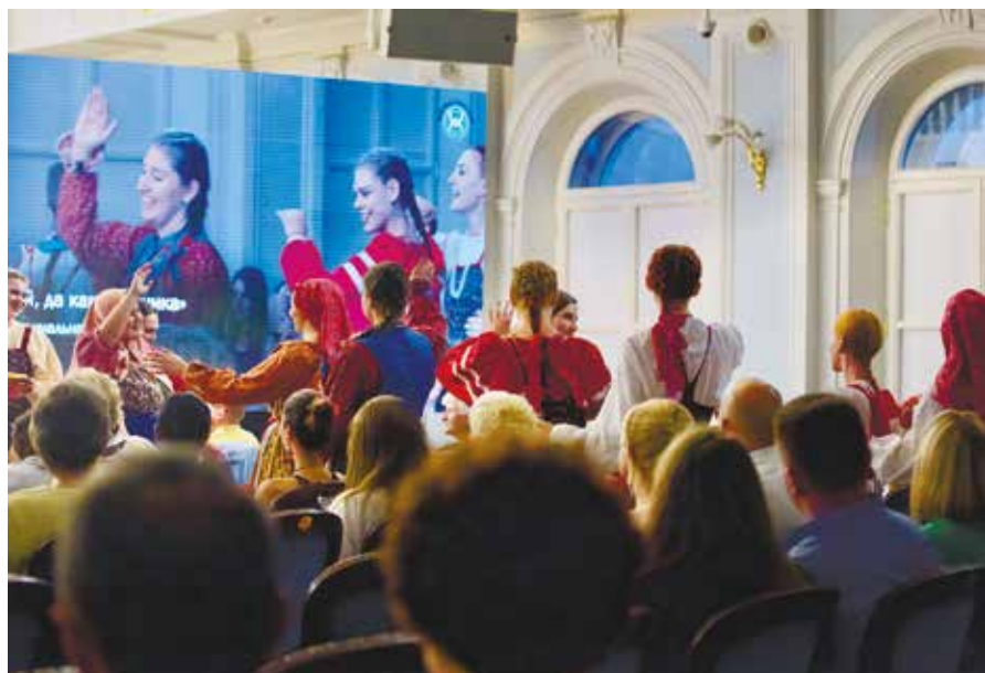
Фольклорный ансамбль «Заигрыши» из Самары

Здесь необходимо пояснить, что упомянутая выше группа музыкантов, представляющих культуру народа сахарави , в силу специфики сообщения между лагерем беженцев на территории Алжира и Москвой, дольше других пребывала в Москву, получив тем самым возможность выступить не только в Консерватории, но и в других местах, таких как Переславль-Залесский или усадьба Знаменское-Губайлово. Всюду их самобытное творчество с огромным интересом воспринималось российскими слушателями, а о пластичных, насыщенных изящными элементами танцах публика отзывалась как о гипнотически завораживающем искусстве.