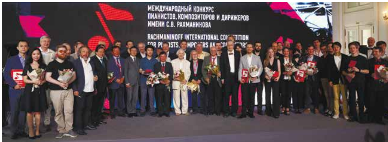
Церемония награждения в Доме Пашкова (27.06.2022)

С толь масштабного Международного конкурса имени Рахманинова, равнозначного, по замыслу организаторов, знаменитому Конкурсу Чайковского, у нас еще не было. И радость Московской консерватории по этому поводу закономерна, ведь именно в Консерватории в 80-х годах прошлого века был впервые учрежден фортепианный конкурс имени ее гениального выпускника. Затем прошло шесть состязаний (1983, 1989, 1993, 1997, 2002, 2008), последние четыре в статусе международных. Дело застопорилось из-за проблем с финансированием. Поэтому нынешнее возрождение Конкурса имени Рахманинова в принципиально новом творческом статусе и при внушительной государственной поддержке обладает особой значимостью.