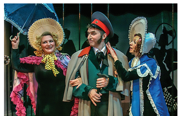
Сцена из спектакля «Нос»