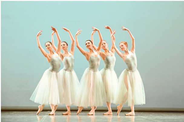
Дж. Баланчин. «Серенада»

24 ноября в рамках проекта «Генеральная репетиция» в Музыкальном театре им. К.С. Станиславского и Вл.И. Немировича-Данченко состоялся премьерный показ одноактных балетов. Программа названа по именам хореографов Баланчин/Тейлор/Гарнье/Экман. Театр пригласил на просмотр молодых людей в возрасте от 14 до 28 лет. Цель акции была обозначена в пресс-релизе: «Нам важно понять, привлекательны ли эти произведения для молодежной аудитории, или ей ближе балетная классика XIX столетия? Мы надеемся, что проект «Генеральная репетиция» поможет нам ответить на эти вопросы».