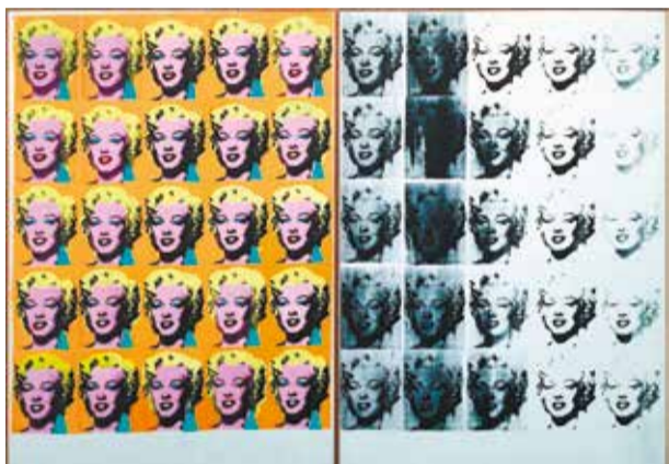
Энди Уорхол. «Диптих Мэрилин»

Энди Уорхол ушел из жизни в 1987 году. Авторская цитата, данная в эпитафии, предлагает относиться к его творчеству просто и диалектически: оно везде и его нет. А что я знаю об авторе и направлении поп-арт, который он представляет? Почти ничего. Самое основное и поверхностное. И связано это, в основном, с уже существующими негативными оценками: это вроде как и не искусство вовсе, во всяком случае, если уж и применять термин «искусство», то в сочетании со словом «массовое». О самом Уорхоло знаю то, что он себя художником не считал и имел образование в сфере дизайна. Будучи человеком довольно ленивым, но стремя-