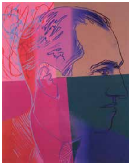
Энди Уорхол. «Джорж Гершвин»

Художник изобразил портрет известной американской актрисы Мэрилин Монро, взяв за основу ее черно-белый фотопортрет. Фактически это цветное тиражное копирование фото в технике шелкографии, позволяющее наносить разные краски особым способом и расцвечивать объект. Я стала рассматривать изображения, вроде бы, повторяющие друг друга, но каждый раз в новой гамме возникал неожиданный динамический эффект только за счет цветовой «перегармонизации» объекта. Как же это здорово! И как Уорхол это придумал?! Цвет самого лица, цвет век, цвет губ, цвет волос создавали