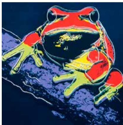
Энди Уорхол. «Вымирающие виды»

Двигаясь дальше по выставке, увидела, что этот прием повторялся и в других работах, например, в изображении Ленина и символов коммунизма. «Красный» Ленин, конечно, смотрится очень драматично, думаю, в это цветовое решение