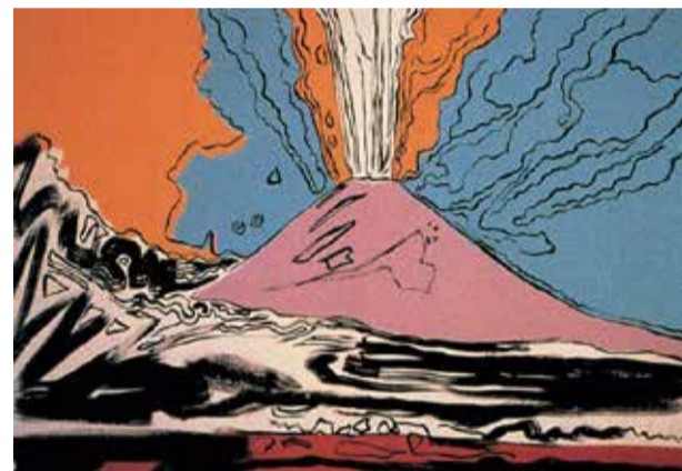
Энди Уорхол. «Извержение»

Художник пробовал работать и в книжной графике, оформляя глянцевые журналы. Особенно впечатляет