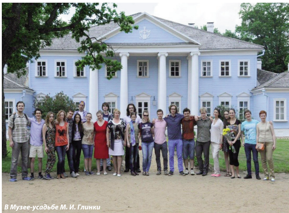
В Музее-усадьбе М. И. Глинки

Здесь раньше вставала земля на дыбы, А нынче – гранитные плиты. Здесь нет ни одной персональной судьбы – Все судьбы в единую слиты. А в Вечном огне виден вспыхнувший танк, Горящие русские хаты, Горящий Смоленск и горящий рейхстаг, Горящее сердце солдата. Владимир Высоцкий